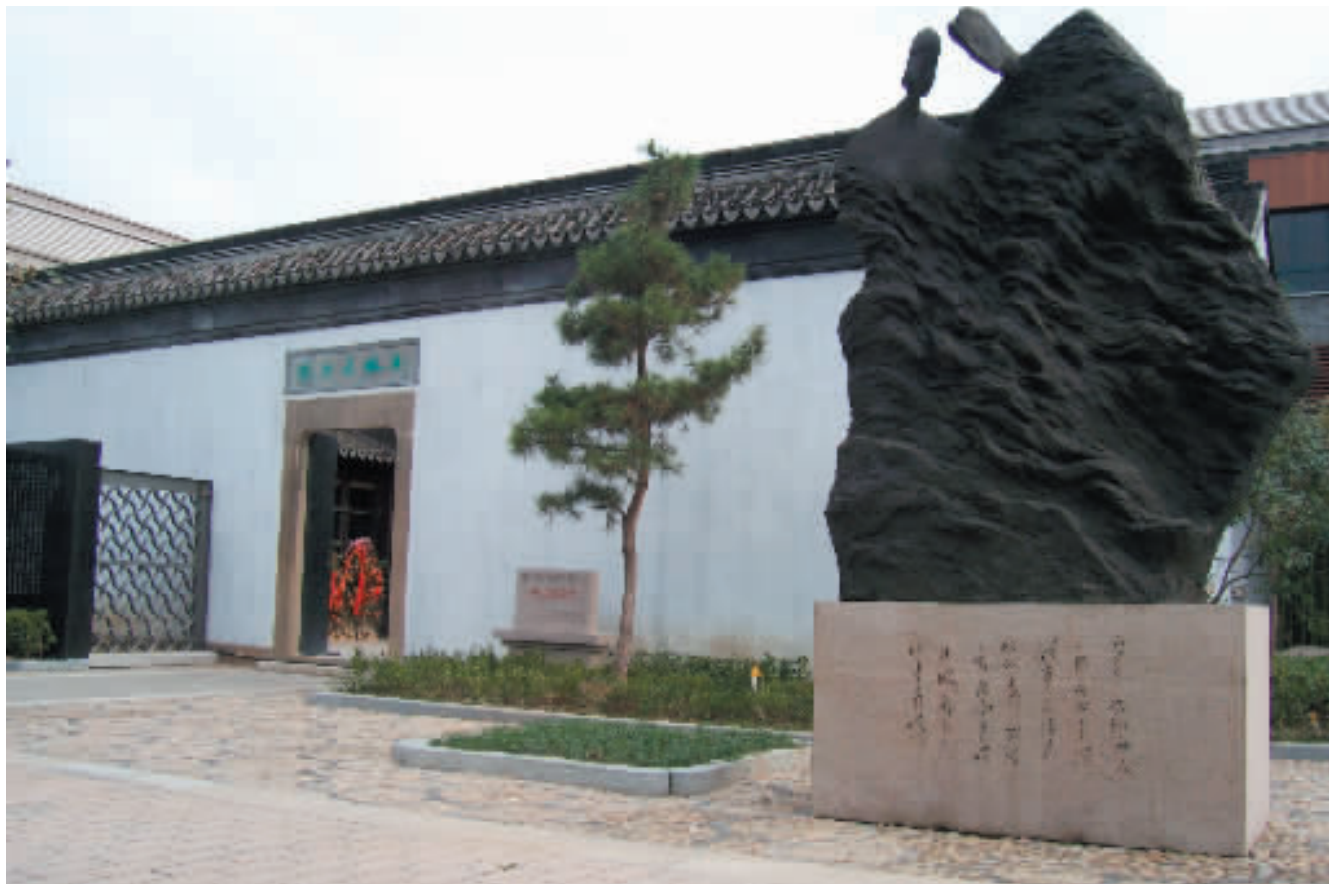
朱生豪故居