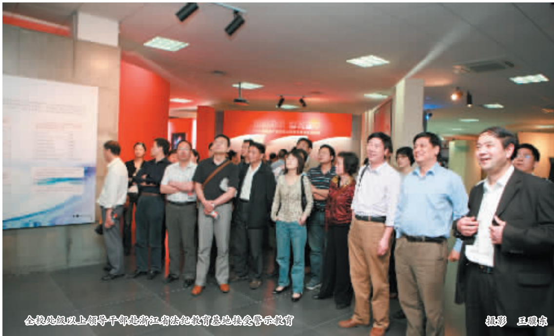
全校处级以上领导干部赴浙江省法纪教育基地接受警示教育

三是完善规章制度的实施机制。学校党风廉政制度是否有效,除了各项规章制度是否完善外,更重要的是制度的实施机制是否健全。离开了实施机制,那么任何规章制度就形同虚设,廉政建设也成为空谈。因此制度的执行是廉政建设的关键环节。为了保证各项制度能有效地执行,应从以下几方面入手:首先,要加强对制度的宣传教育,树立制度权威。要加强对各项制度的宣传解释,使各级干部和广大师生员工了解制度,形成对制度的“敬仰感”,做好执行制度的思想、心理、知识和能力准备。其次,要加强对制度执行情况的督查,保证各项制度的有效实施。要建立对各项管理制度执行情况的督查机制,定期通报制度的执行情况,加强责任追究,有效发挥制度在廉政建设中的保证作用。同时,也要加强对制度实施情况进行科学的评估,不断查找制度的漏洞,及时做好制度的修订工作。