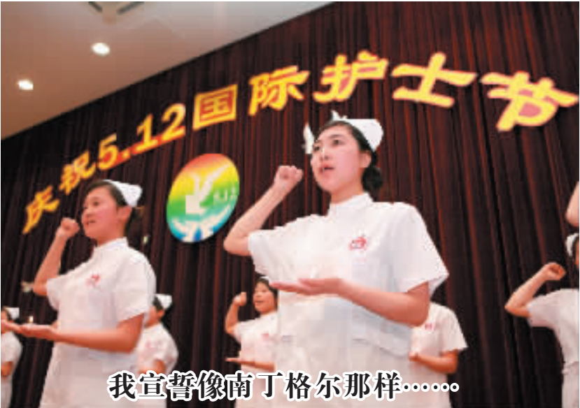
我宣誓像南丁格尔那样……

5月12日中午,医学院在梁林校区TCL报告厅举办庆祝“5·12国际护士节”纪念活动。护理专业的同学们举行了庄严的宣誓仪式,重温南丁格尔誓言,并纷纷表示热爱专业,刻苦学习,努力成为一名合格的白衣天使。