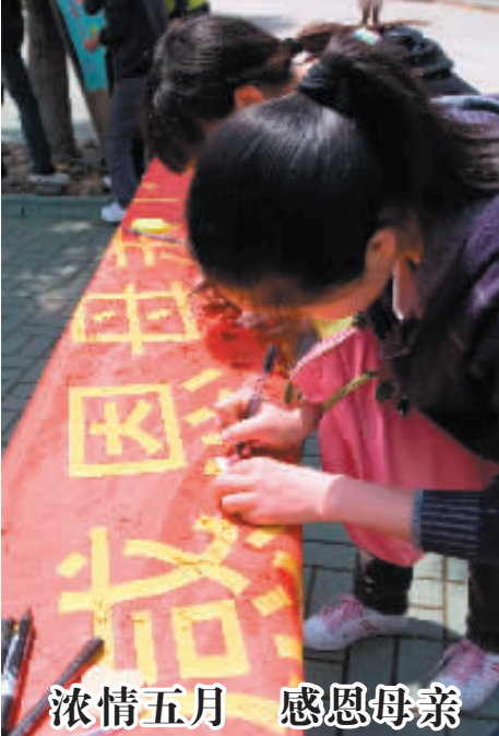
浓情五月 感恩母亲

5月12日中午,医学院在梁林校区TCL报告厅举办庆祝“5·12国际护士节”纪念活动。护理专业的同学们举行了庄严的宣誓仪式,重温南丁格尔誓言,并纷纷表示热爱专业,刻苦学习,努力成为一名合格的白衣天使。