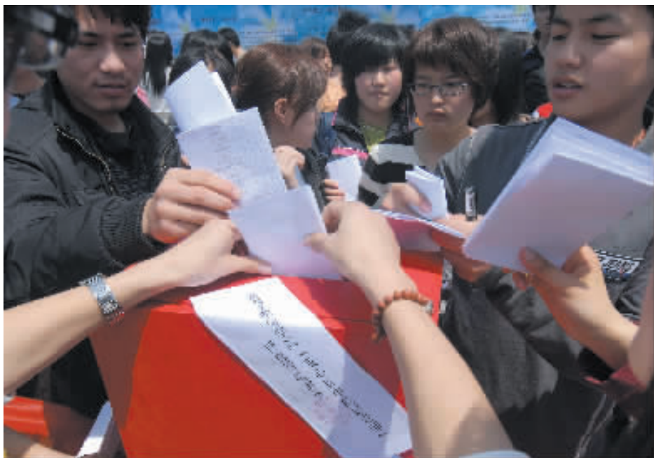
首届“我心目中的好老师”评选活动投票现场

评选条件 1、有较高的思想道德素质,坚持党的基本路线、拥护中国共产党的领导; 2、爱岗敬业,勤慎治学,锐意创新,具有较强的奉献精神和业务素质,教学效果良好; 3、教书育人,为人师表,严于律己,具有较强的责任心,将育人贯穿于教学过程之中; 4、深入学生,关心学生,爱护学生,尊重学生,深受广大同学爱戴。