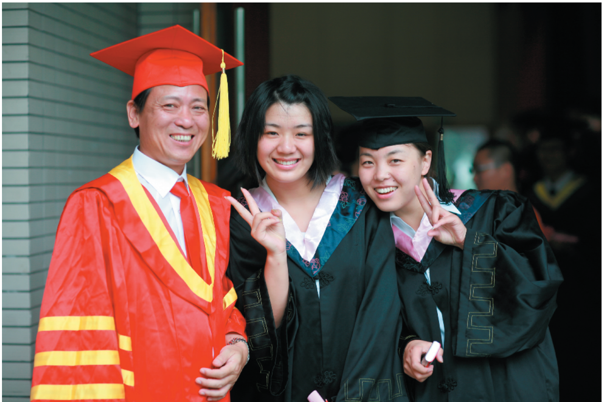
与校长分享我们的成功